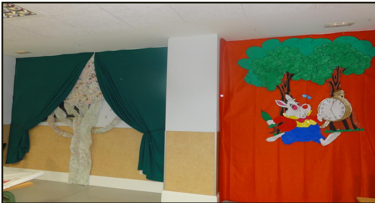
Sala de usos múltiples