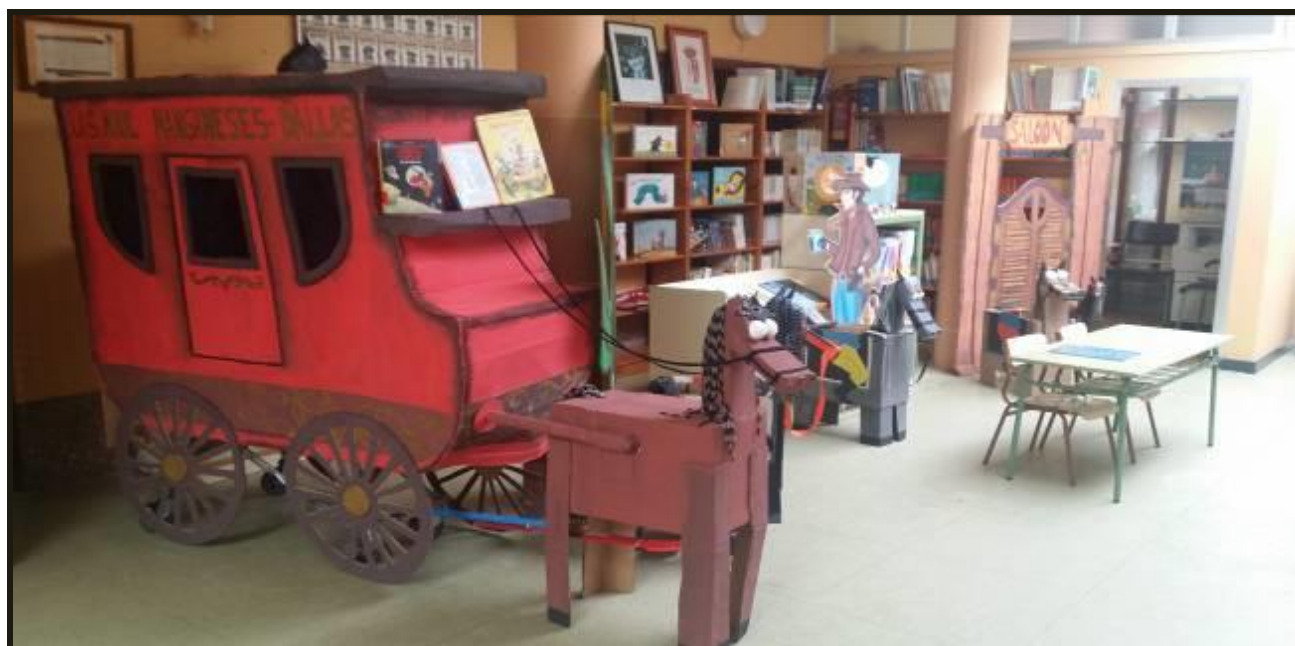
Pasillos del centro

CRA “TRES RÍOS”. Manganeses de la Polvorosa.