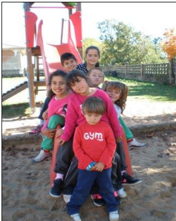
Primer fotograma y los viajeros dicharacheros