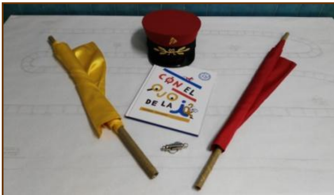
“Los viajeros dicharacheros”