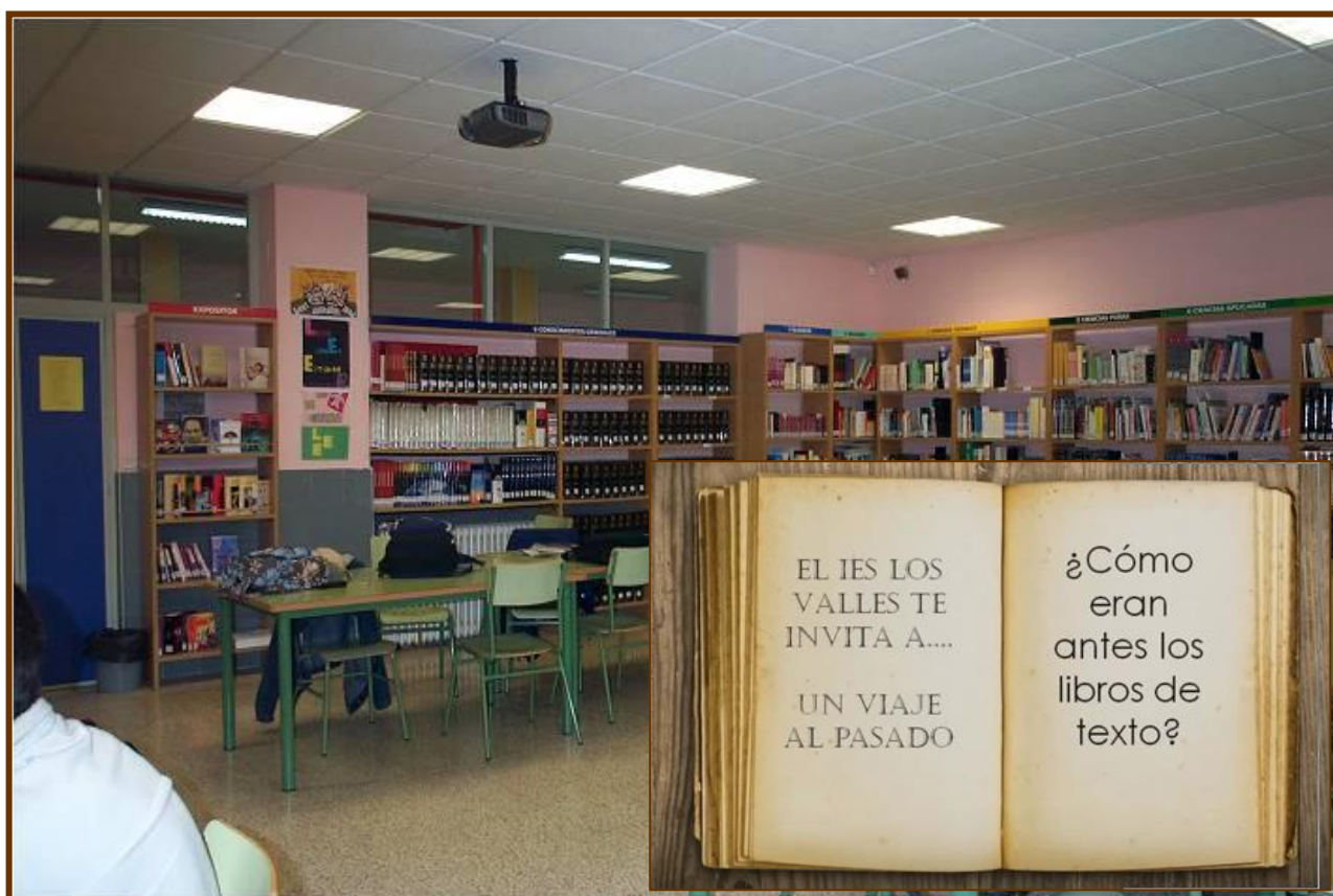
Biblioteca del IES Los Valles